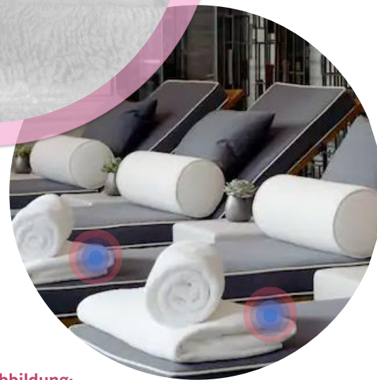
2. Abbildung: Unsere RFID-Microchips