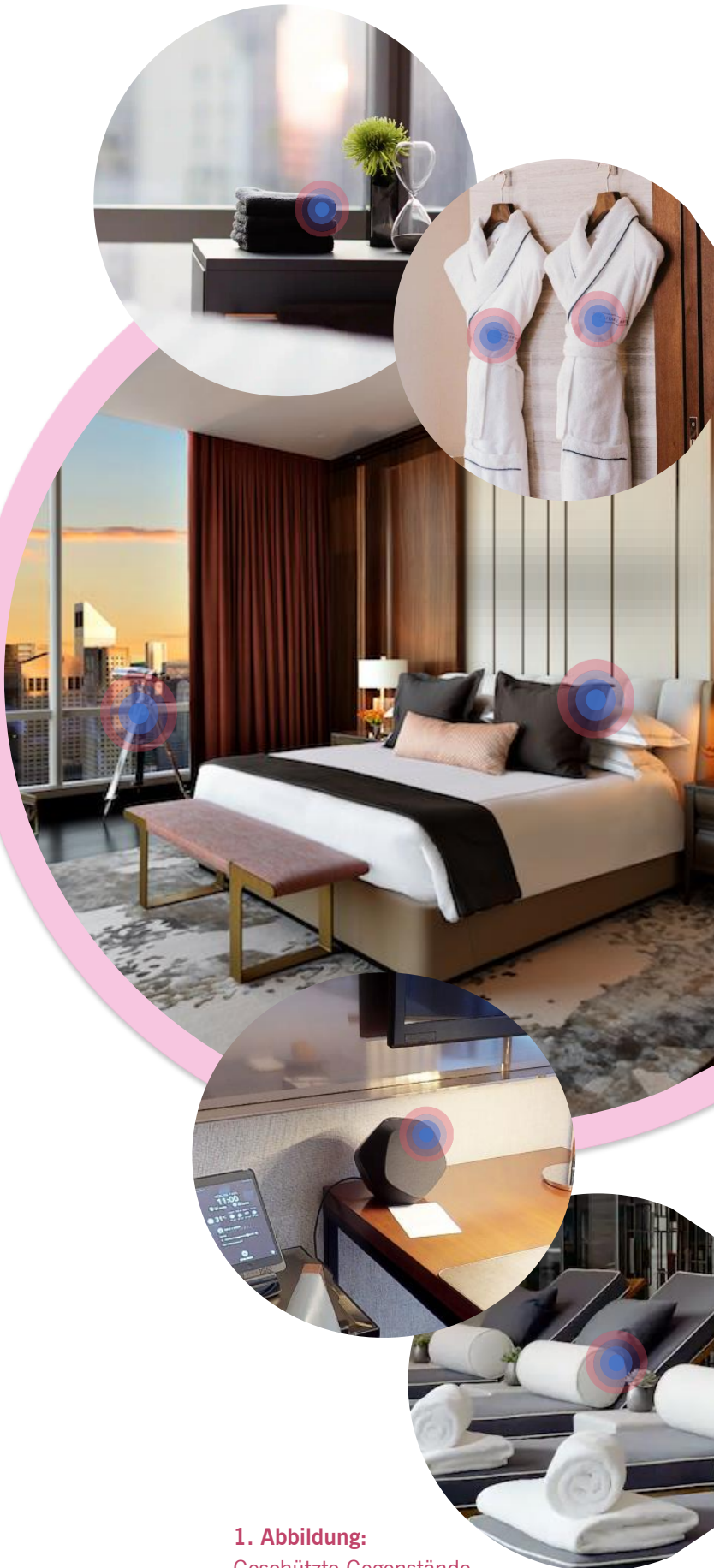
1. Abbildung: Geschützte Gegenstände mit RFID-Microchips